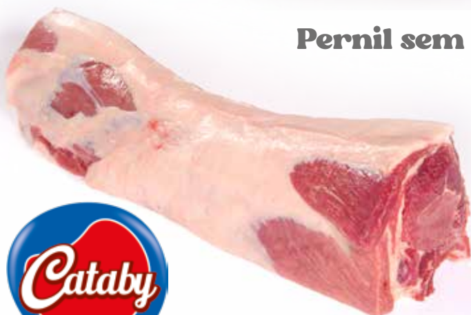
Pernil sem Pele