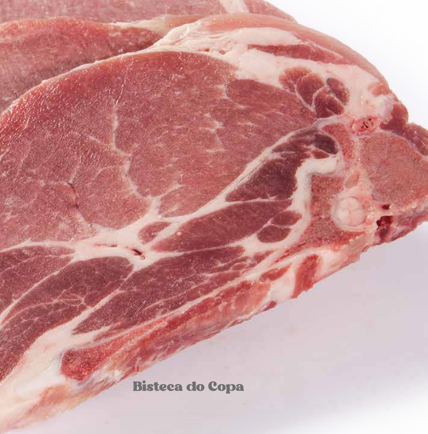
Bisteca do Copa